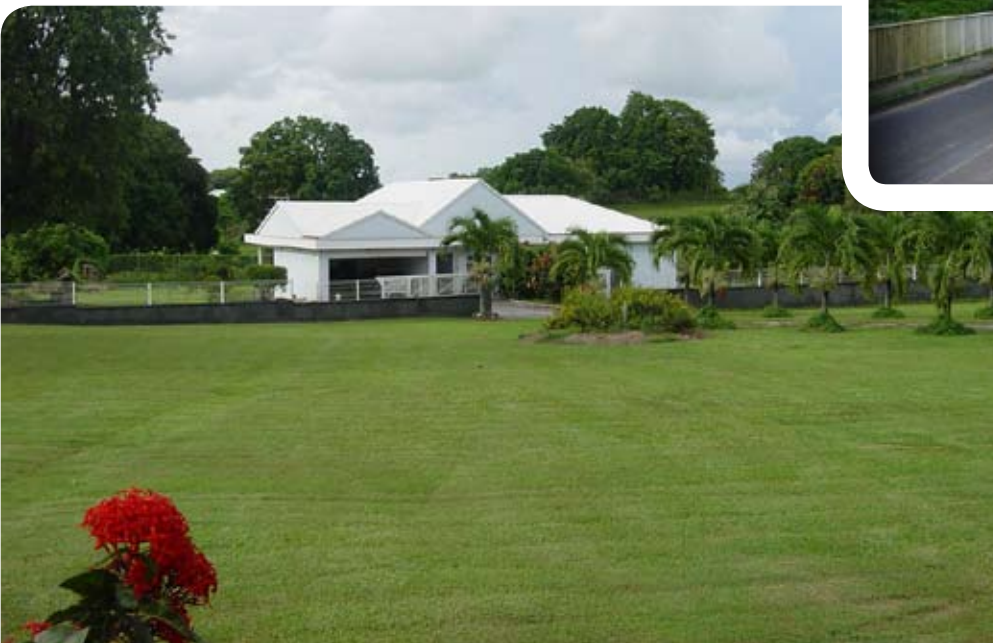
La maison voisine du terrain