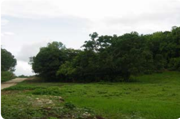
Vues du terrain