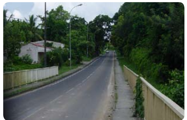
Voie d'accès au terrain