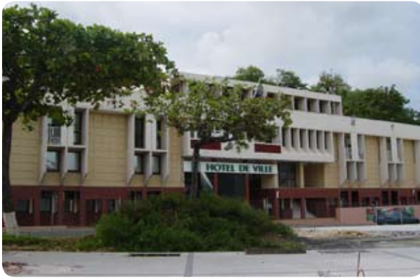
L'Hôtel de ville des Abymes