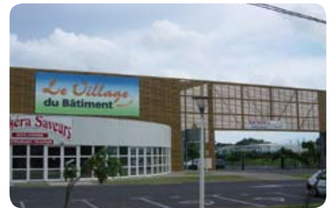
Parc d'activités à proximité du terrain